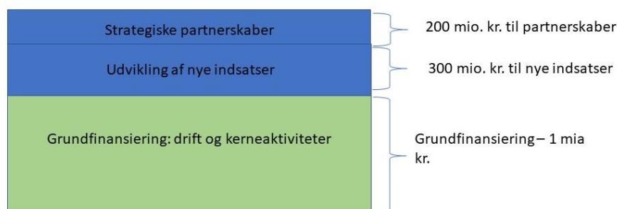
Figur 2: Fordeling af finansieringselementer

Midlerne til den samlede model kan delvist findes på følgende vis: